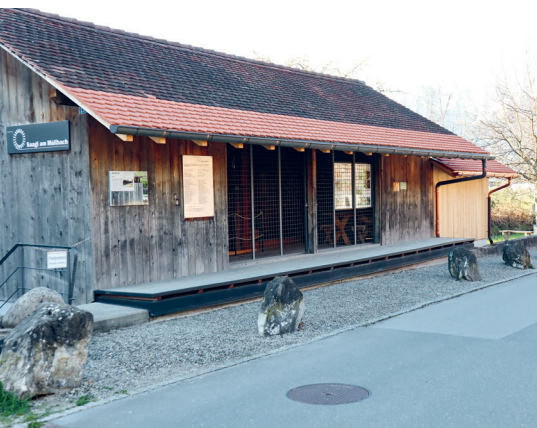
Dachverlängerung und neues Podest auf der Nordseite.