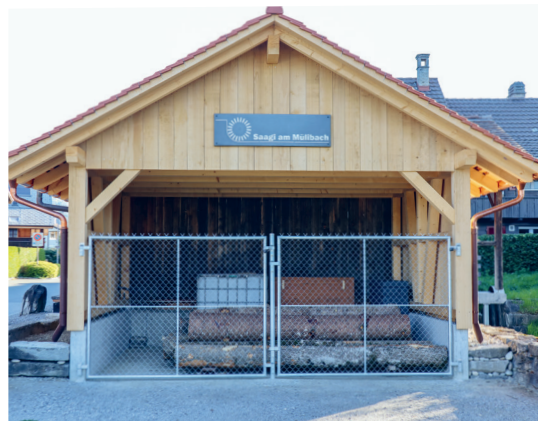
Anbau mit Lagerplatz auf der Westseite.