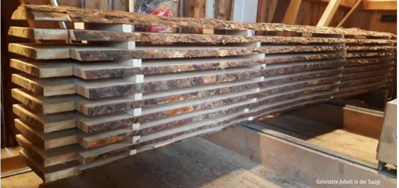
Geleistete Arbeit in der Saagi