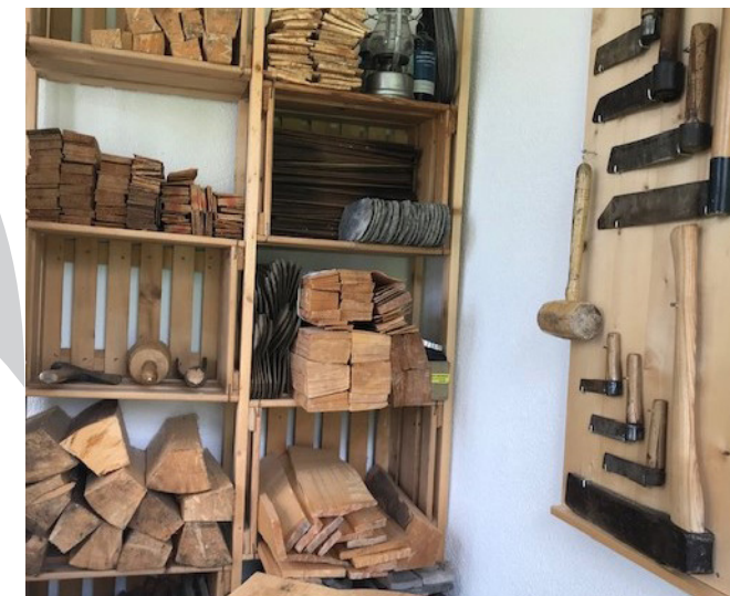
Blick in die Schindelwerkstatt